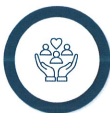
Măsuri suport în domeniul Serviciilor

În funcție de nevoile familiei/persoanei singure, venitul minim de incluziune este însoțit de alte măsuri de asistență socială complementare, acordate în bani și/sau în natură: