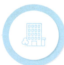
Măsuri suport în domeniul Locuirii