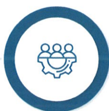
Măsuri suport în domeniul Ocupării