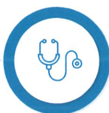
Măsuri suport în domeniul Sănătății