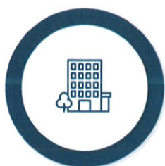
Asigurarea obligatorie pentru locuință

În funcție de nevoile familiei/persoanei singure, venitul minim de incluziune este însoțit de alte drepturi complementare, plătite de la bugetul de stat sau după caz, din bugetul local: