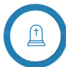
Ajutorul pentru înmormântare