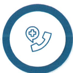
Ajutoarele de urgență (de la bugetul de stat și de la bugetul local)