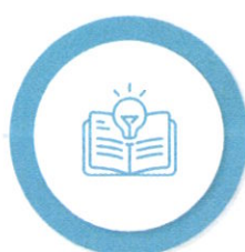
Măsuri suport în domeniul Educației